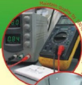
Maintain quality by 100% final inspection