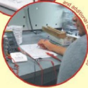
and additional samples at the lab